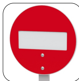
2609 DIVIETO DI ACCESSO