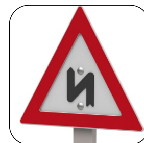
2605 CURVA DOPPIA