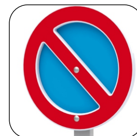
2611 DIVIETO DI SOSTA