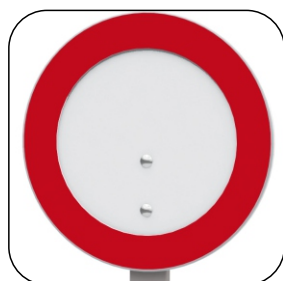
2606 DIVIETO DI TRANSITO