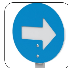
2612 DIREZIONE OBBLIGATORIA